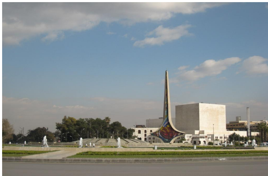
伍麦叶广场——叙利亚首都标志性建筑

【政府】内阁是国家最高行政管理机构，内阁成员由总统任命并向总统负责。2021年8月，受总统阿萨德委托，总理阿尔努斯组建新内阁，共有30名成员。