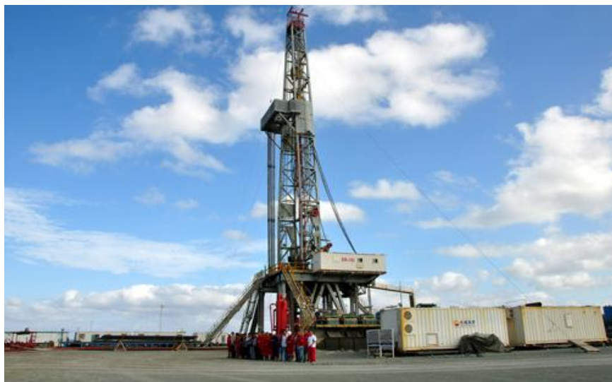
位于古巴哈瓦那近郊的石油钻探基地

据中国商务部统计，2020年中资企业在古巴新签承包工程合同37份，新签合同额3.14亿美元，完成营业额1.42亿美元。中方累计派出各类劳务人员167人，年末在古巴劳务人员383人。