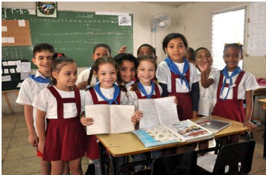
身着校服的古巴小学生

【教育】古巴政府历来重视发展教育。目前，古巴是拉美地区识字率和平均受教育水平最高的国家，教育水平居世界前列。根据联合国教科文组织《2015全民教育发展指数》，古巴在117个国家（地区）中排第28位，在拉丁美洲国家中排名第一。