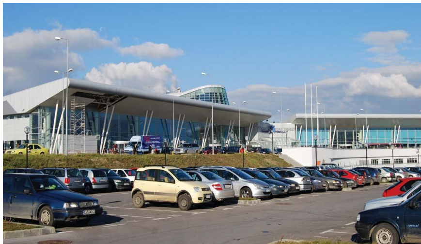
保加利亚首都索非亚市机场