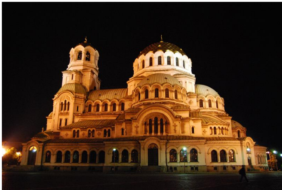
首都标志性建筑——涅夫斯基教堂

首都索非亚，人口约132.5万，是保加利亚政治、经济、文化中心。第二大城市是普罗夫迪夫，第三大城市是瓦尔纳。